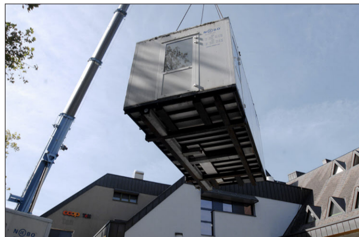
Eine der portablen Küchen hängt am Langenthaler Himmel. Mittlerweile sind sie unterwegs nach Belgien. Robert Grogg

Gestern Mittag starteten die zwei Küchencontainer vor dem Coop Tell in Langenthal erst zu einem Höhenflug und dann zu einer langen Reise. Per Kran wurden sie über die Baumwipfel gehievt und dann auf einen Lastwagen verladen. Bald schon werden darin belgische Köche arbeiten.