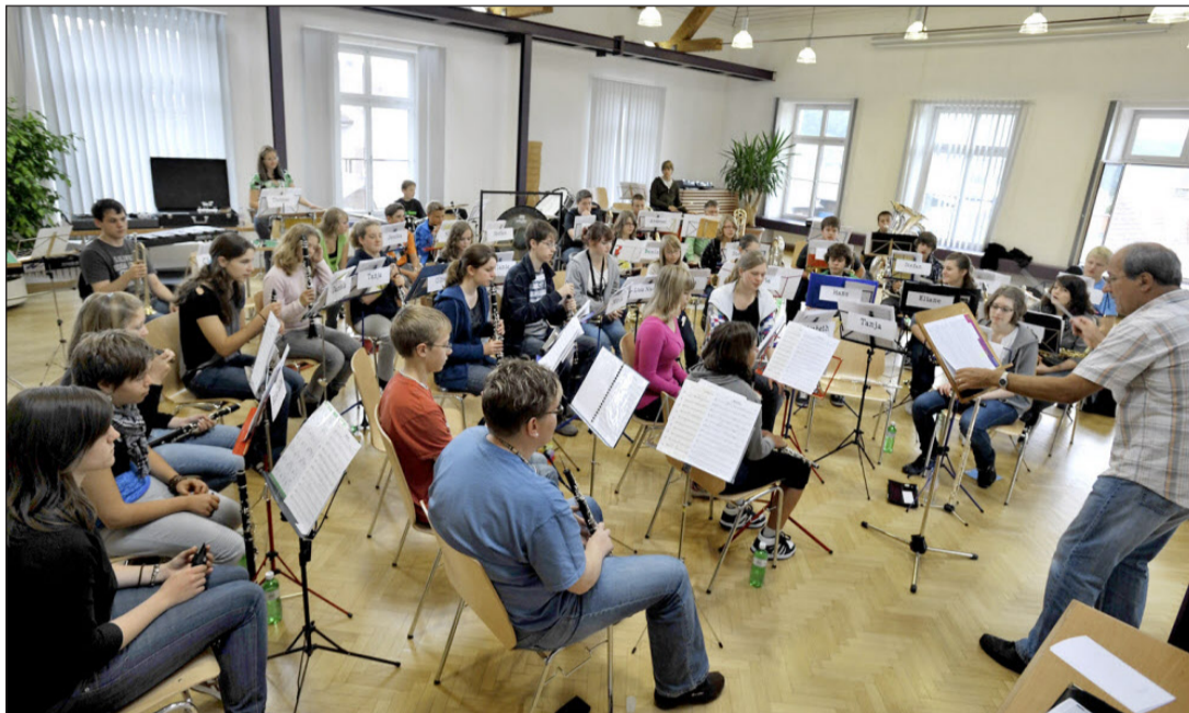
Musizieren statt ausspannen in den Herbstferien: 40 Kinder machen beim Jugendmusikcamp mit.